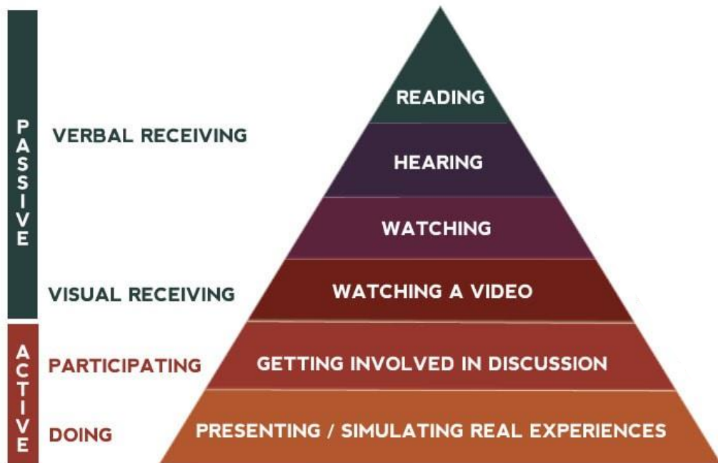
THE LEARNING CONE (EDGAR DALE 1969)

il role-play è la rappresentazione scenica di una interazione personale che richiede di assumere comportamenti idonei alla situazione proposta