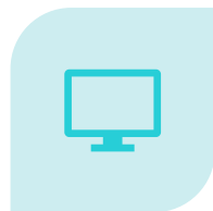
IL WEB MARKETING