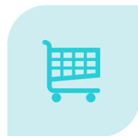
IL MERCATO DELL'OTTICA

L'occasione per acquisire competenze manageriali avanzate e tutti gli strumenti necessari a gestire con efficacia un Centro Ottico.