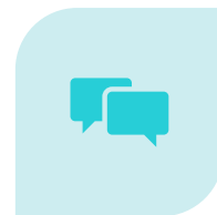
IL SOCIAL MARKETING