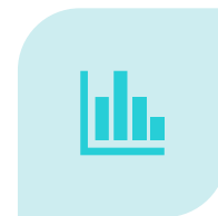
IL CONTROLLO DI GESTIONE E L'ANALISI DEI DATI